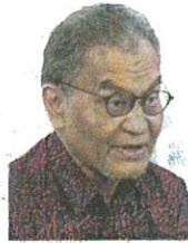
Dr Dzulkefly Ahmad

Menteri Kesihatan, Datuk Seri Dr Dzulkefly Ahmad, berkata langkah itu bertujuan menyelesaikan masalah kekurangan pakar perubatan yang berkhidmat di fasiliti kesihatan kerajaan di negara ini.