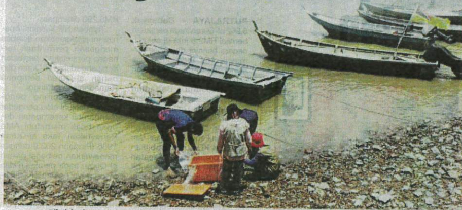
Pihak berkuasa mengambil sampel kupang dan kerang sekitar perairan Port Dickson untuk dianalisa.

Enam individu lain dimasukkan ke hospital akibat keracunan