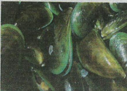
Beberapa individu dirawat selepas mengalami gejala keracunan makanan disyaki akibat memakan kupang dan kerang bertoksik yang diperolehi di sekitar perairan Port Dickson. Gambar hiasan

"Saya tidak pasti apa punca sebenar (keracunan) tetapi kebanyakan penternak mendakwa menjumpai lebih banyak kerang mati berbanding kupang," katanya.